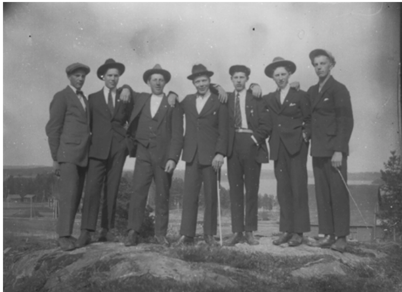
På Lindbergsberget. OBS! Collinghuset som skymtar längst till höger.