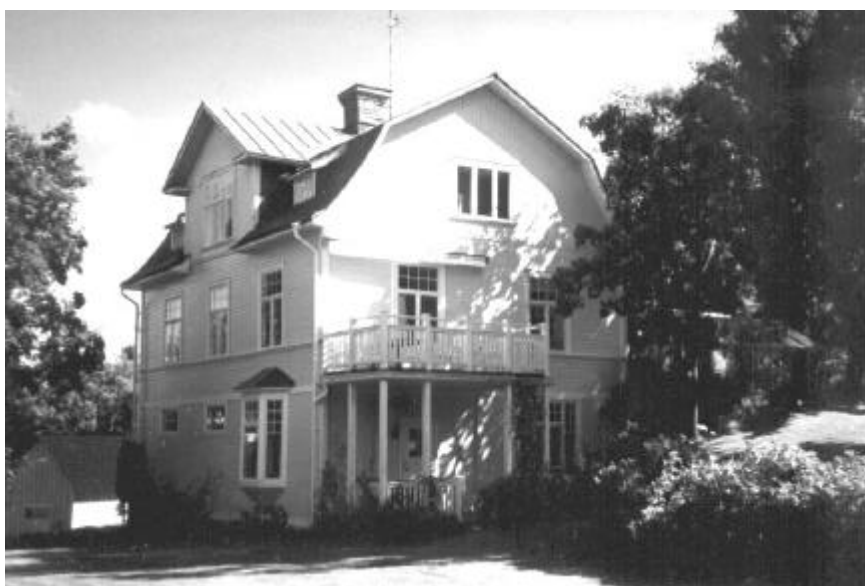
Huset idag från norr. På sydsidan finns trädgården med växthus och dammar.